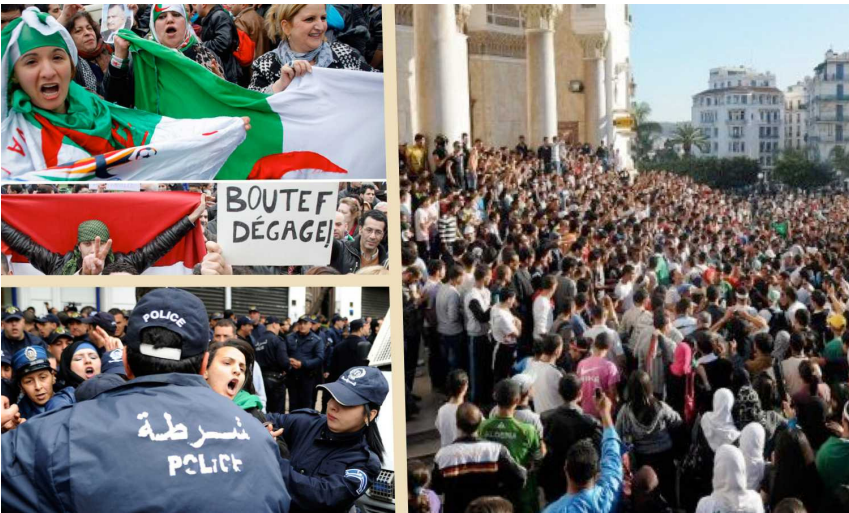
Algérie : importantes manifestations de rue contre la candidature de Bouteflika.